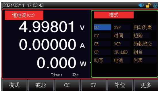
四种定态测试模式: CC、CV、CR、CP动态测试