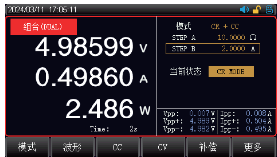
组合测试: CR+CC, CV+CR, CV+CC