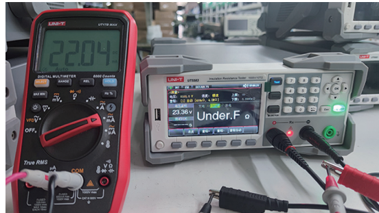
>20mA充电电流, 测试充电更快速